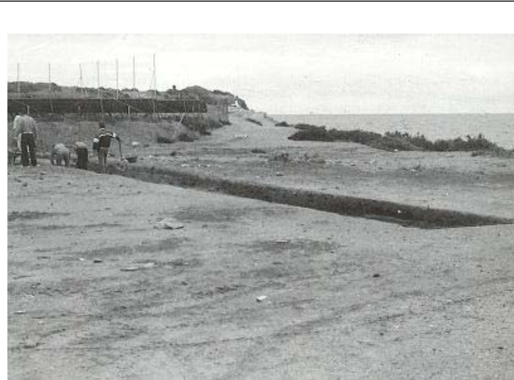
VISTA GENERAL DE UNO DE LOS SONDEOS REALIZADOS EN LA ZONA DEL ISTMO DE TABARCA.