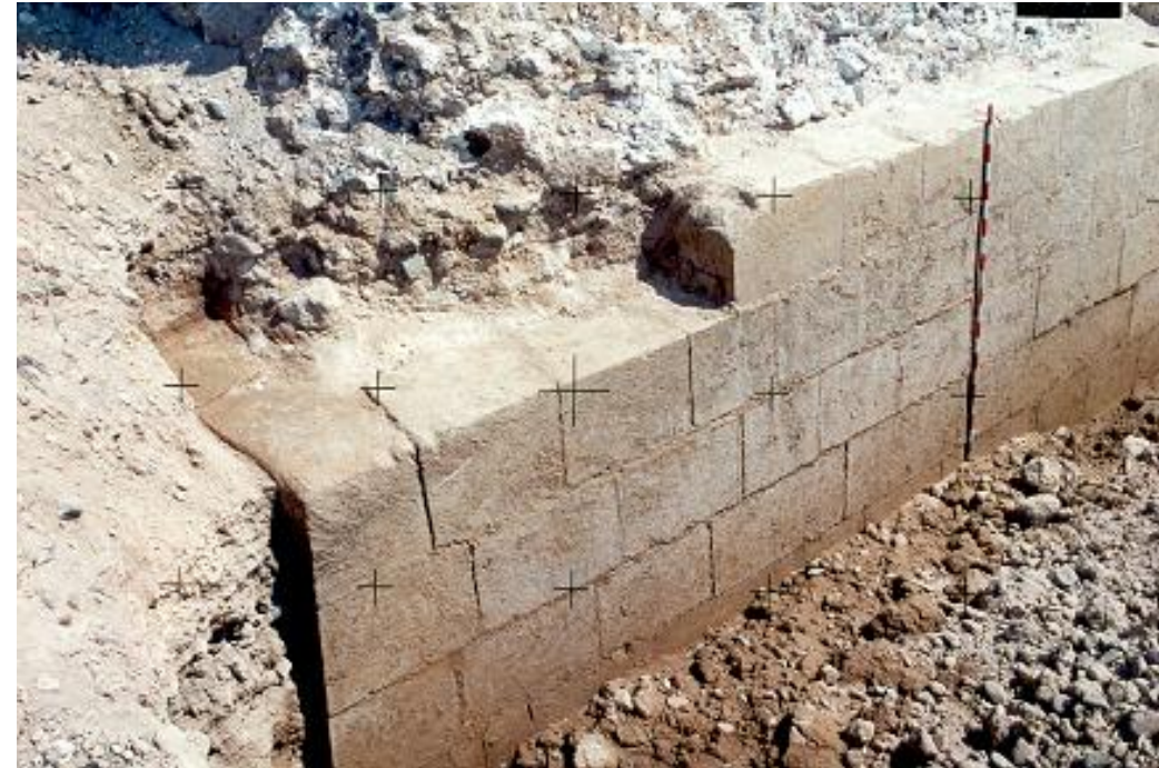
DETALLE DEL ALZADO DE SILLERÍA DEL REVELLÍN DEL REAL INFANTE DE TABARCA.