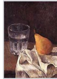
Sense Títol Oli sobre taula 29 x 24 cm

Eusebio Sempere Juan naix a Onil, una xicoteta localitat de la província d'Alacant, el 3 d'abril de 1923. Amb 17 anys, marxa a València, en plena postguerra espanyola, per estudiar a l'Escola de Belles Arts on les ensenyances de l'art modern estaven proscrietes. Va prendre llavors la important decisió d'instal·lar-se a París i allí, amb enormes penúries econòmiques, va aconseguir relacionar-se amb els supervivents de les avantguardes històriques i amb aquells corrents constructivistes afins a les preocupacions estètiques pròpies de la seua investigació individual com a artista. Immers en esta tendència geomètrica fa la seua aportació personal al moviment cinètic. El 1960, Sempere torna a Espanya, no perd el contacte amb València i s'integra en el Grupo Parpalló, però s'instal·la a Madrid i allí es relaciona amb els més destacats informalistes, el Grupo de Cuenca i amb els realistes madrilenys, tots companys i amics.