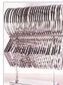
Cercle i quadrat , 1979 Acer cromat 94 x 70 x 35 cm