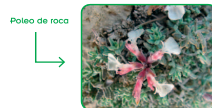
Poleo de roca