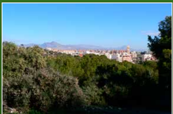
Densitat de la pineda a la cara nord

Hem retrocedit sobre els nostres passos. Ara fem un tram que presenta una certa dificultat física, (podent optar pel recorregut dels trams 4 i 3 per enllaçar amb el punt 8). A uns 35 m abans de la bifurcació, pugem pel lateral zigzaguejant terrasses d'antics cultius on s'entremescla la malva blanca, malva de roca o malva marina ( Lavatera maritima ). Finalment, continuem uns passos sobre la pedra aterassada fins que iniciem un xicotet però abrupte ascens per la roca, i ens trobem amb unes empinades escalinates que ens conduïxen cap a la senda en direcció nord-est, entreveient la Serra Grossa i el Cap de l'Horta. Entre la vegetació, distingim el xiprer de quatre valves o savina de Cartagena ( Tetraclinis articulata ) i l'aspecte pilós del manrubí hirsut ( Ballota hirsuta ); augmentant progressivament la pineda sobre els matolls basòfils. Continuem fins a entreveure la part nord de la ciutat amb el Cabeçó d'Or de fons. Descendim per unes escalinates fins a la intersecció de la senda.