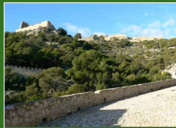
Ascens pel Raval Roig

L'esquerra, continuem en direcció est, veient matoll termomediterrani, amb abundància d'arçot ( Rhamnus lycioides ) i llentiscle ( Pistacia lentiscus ). El camí de terra descendix fins a arribar arran del carrer de la Mare de Déu dels Socors.