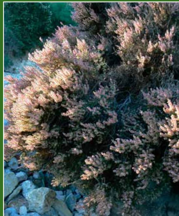
Salat negra ( Salsola oppositifolia ) a la tardor