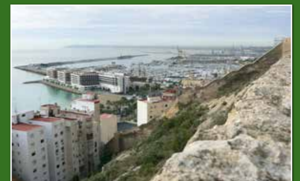
Vista de la badia i el port d'Alacant

d'una forma intencional, ja que, com a cultiu agrícola, suposava una bona font d'aliment per a la còtxinilla ( Dactylopius coccus ) productora de tint o colorant natural (àcid carminic), i també pel seu fruit comestible: la figa de pala.