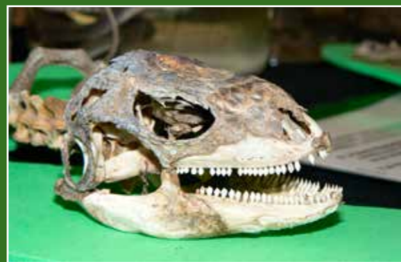
Crani de fardatxo ( Lacerta lepida ). Expo CEAM Benacantil

Voregem la fortalesa davall el revellí del Bon Repòs, en direcció oest. Ens trobem immersos en la frondositat de la pineda, aïllant-nos del soroll de l'urbs, a la recerca d'assossec. És ací quan gaudim del trànsit i el cant de xicotetes aus com el gafarró ( Serinus serinus ) i el verderol ( Carduelis chloris ).