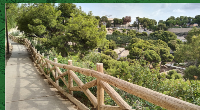
• Tram final de la senda i pineda del Tossal

Continuem el camí al costat del mur que confronta amb el CEIP Prácticas - La Aneja, un col·legi públic que ocupa les antigues instal·lacions de l'Escola de Magisteri de 1964.