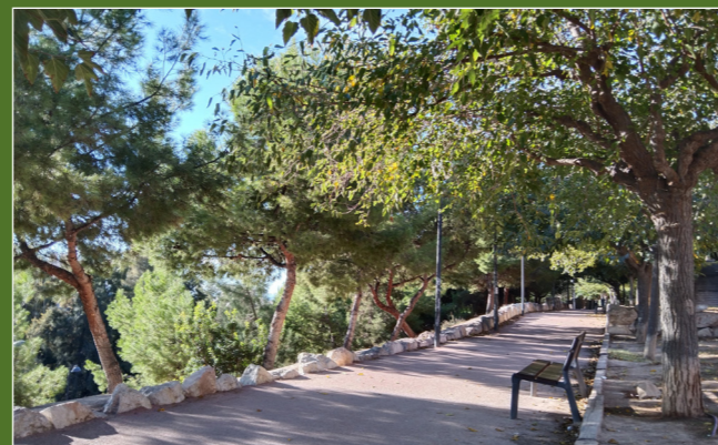
• La senda pel vessant est

Continuem per la primera senda interior a la dreta, en direcció sud-est. Més endavant, pugem per unes escalinates agafant com a referència visual la torre de la caseta transformador.