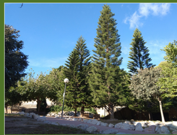
• Conjunt d'araucàries excelsa i arbre de Judes

5 250 m | Arribem a una bifurcació i baixem per la nostra esquerra i, poc després, girem a la dreta per la senda que es creua fins a arribar als voltants del carrer de la Ronda del Castell.