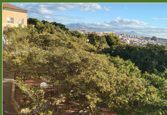
• Parc 'El Tossal'

1 0 m | Iniciem l'itinerari enfront de la rotonda, on se situa el monument als herois de la Guerra de la Independència, confluència dels carrers Catedràtic Jaume Mas i Porcel i Escultor Bañuls.