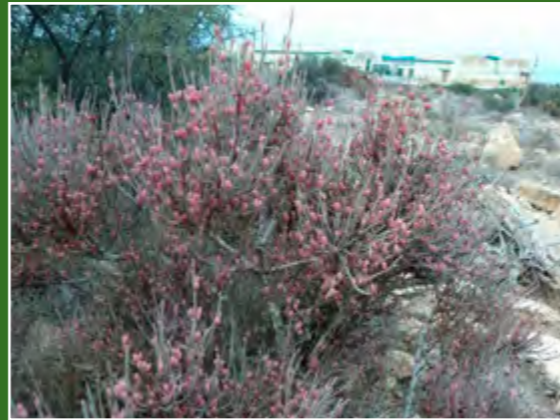
Efedra fragilis en fructificació

Pots consultar tota la informació actualitzada sobre les Sendes Urbanes en la web: https://www.facebook.com/senderosurbanosalicante