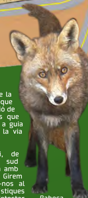
Rabosa ( Vulpes vulpes )

Reprenem la senda i, de baixada, en direcció sud arribem a la confluència amb el Camí de l'Abellar. Girem a la dreta incorporant-nos al camí. Per les característiques del terreny, podem detectar indicis del pas de raboses ( Vulpes vulpes ), principalment per les seues empremtes d'uns 5 centímetres de llarg i 3 o 4 d'amplie, molt semblants a les d'un gos xicotet.