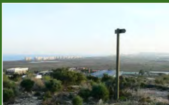
Mirador d'Aigua Amarga

Mirador d'Aigua Amarga. Veiem una gran extensió (1,8 km 2 ), una zona deprimida vora el mar que correspon al saladar d'Aigua Amarga. És un zona humida de llacuna soma (de poca profunditat) temporal que manté una certa comunicació amb el mar i que, en règim natural, es nega per l'escolament superficial o flux d'aigua, de pluja i d'altres fonts sobre la terra, i també per la subterrània. Les rambles i els torrents de la serra dels Abellars incidixen en el procés de reblliment de la zona humida.