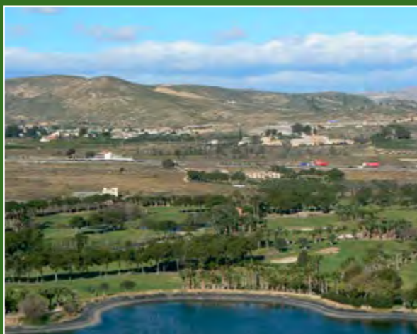
Serra de Borbunyo i El Bacarot

Mirador del Bacarot. Ací s'aprecia el camp de golf "El Plantío", en contrast amb l'ambient rural de la zona. Les serres més pròximes són la de Borbunyo i la de Sanxo, pròxim a estes i separat per la carretera es troba el nucli principal de població del Bacarot. Com a conseqüència del projecte per a ampliar les instal·lacions del camp de golf, sorgix l'excavació arqueològica del jaciment d'Abellars que s'emmarca en el context històric de l'Ibèric Ple, i pren força l'existència del mateix topònim de la partida rural del Bacarot, en la seua forma 'Bagarok' que significa lloc on es garbella la producció de gra.