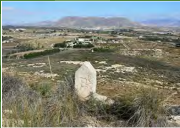
Vista de la serra de Fontcalet

A 80 metres, ens desviem per una xicoteta senda abrupta i empinada que enllaça amb el tossal següent. Com a alternativa, l'enllaç també es pot fer pel Camí de l'Abellar en direcció sud i, a uns 300 metres, en la intersecció de la via pecuària agafem la senda ascendent.