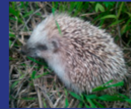
Cría de erizo ( Erinaceus europaeus ) en La Ereta

15 izquierda aparece un edificio semienterrado, sombreado por unas mamparas e integrado en el paisaje: la Sala de Exposiciones (15); concebida como un espacio expositivo polivalente, se destinó principalmente al arte actual, desde su apertura en 2005. Nos encontramos en la Plaza de La Ereta (16), gran terraza donde se ubican unas gradas de piedra caliza en uno de sus extremos y, en otro, bajo el suelo unas instalaciones que se diseñaron posteriormente como almacén y camerinos para el desarrollo de espectáculos. En el mirador sur de la Plaza hay instalados varios juegos de mesa que forman parte de los servicios lúdicos.