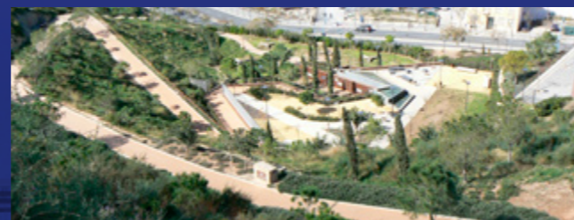
Enlace con parque de La Tuna

13 Nos dirigimos hacia el umbral de Sant Jordi (13), a 109 m sobre el nivel del mar en la parte más alta del Parque. Saliendo de éste, en línea recta hay un corto camino que enlaza con el Castillo de Santa Bárbara (finales s. IX), nosotros giraremos a la izquierda para iniciar un pequeño recorrido de unos 120 m en descenso con amplias vistas sobre la Muralla Medieval (14) aunque su longitud total supera los 500 m. Salimos por el tramo medio (antes de llegar al puente), bajando por un camino con baldosas intercaladas en el terreno que enlaza con el recorrido principal del itinerario. De nuevo llegamos al acceso norte; aquí tendremos la opción de continuar con el trazado marcado o salirnos del mismo para tomar un camino que comunica con el nuevo parque de La Tuna, un proyecto ejecutado por Aguas Municipalizadas de Alicante que, en parte, ha supuesto la restauración paisajística de la ladera suroeste del monte Benacantil, comunicándolo con el centro de la Ciudad.