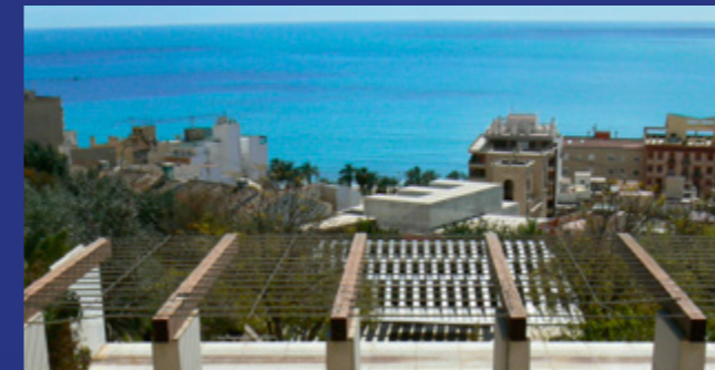
Pérgola - Jardín del Agua

16 Descendemos hasta la Pérgola y el Jardín de Agua (17), entre plantas de zonas húmedas y otras bulbosas, así como variedad de hibisco ( Hibiscus rosa-sinensis / Hibiscus syriacus ). Los papiros ( Cyperus papyrus ) y el bambú ( Bambusoideae ) hacen de pantalla a las grandes jacarandas ( Jacaranda mimosifolia ) y a las poligalas ( Polygala myrtifolia ). También veremos el árbol de la fortuna de los romanos: el jinjolero ( Ziziphus zizyphus ), de tronco espinoso y pequeño fruto comestible. Esta zona, por su proximidad al núcleo urbano, es transitada por aves como el mirlo común ( Turdus merula ), el verdicillo ( Serinus serinus ) y la abubilla ( Upupa epops ) con su singular moño y canto "bub-bub-bub" por el que recibe ese nombre.