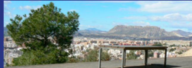
Mirador Colina Alta

12 Fuera de este tumulto y en bordes de la roca, en ocasiones es posible observar y distinguir al cernícalo común ( Falco tinnunculus ), con su característico sonido "hihi-hi" en vuelo. Sobre nuestros pasos retrocedemos 80 m para incorporarnos al Paseo Alto. En sentido ascendente llegamos al Mirador de la Colina Alta (12); con una perspectiva noroeste divisamos montes alicantinos como la sierra de Fontcalent y la sierra Mediana entre otros.