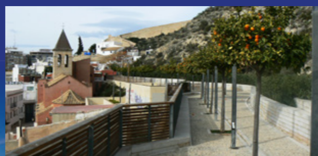
Lindero - San Roque