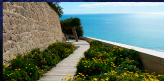
Jardín del Ángel

Dominando el Mar y la Playa, es un lugar extraordinario para relajarse con la prolongación de la vista hasta el Cabo de Santa Pola y, más al sur, la alicantina isla de Nueva Tabarca. Nos encontramos bajo el Macho del Castillo, a 87m de altura, inmersos en un promontorio rocoso que por su altura y singular orografía se presta