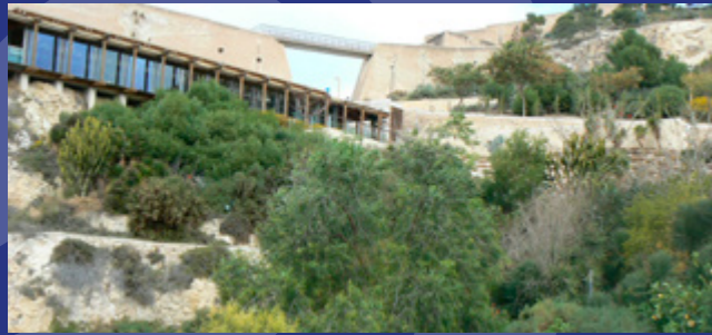
Grupo de flora en La Ereta

9 conducen al restaurante (9); a la izquierda hay una zona para la observación de un grupo diferenciado de flora compuesto por piteras ( Agave americana ), yucas ( Yucca schidigera / Yucca gloriosa ), chumberas ( Opuntia ficusindica ), plantas tapizantes como el mioporo ( Mioporum pictum ) y el escobillón rojo ( Callistemon citrinus ), este último más conocido como "limpiatubos" por su peculiar forma.