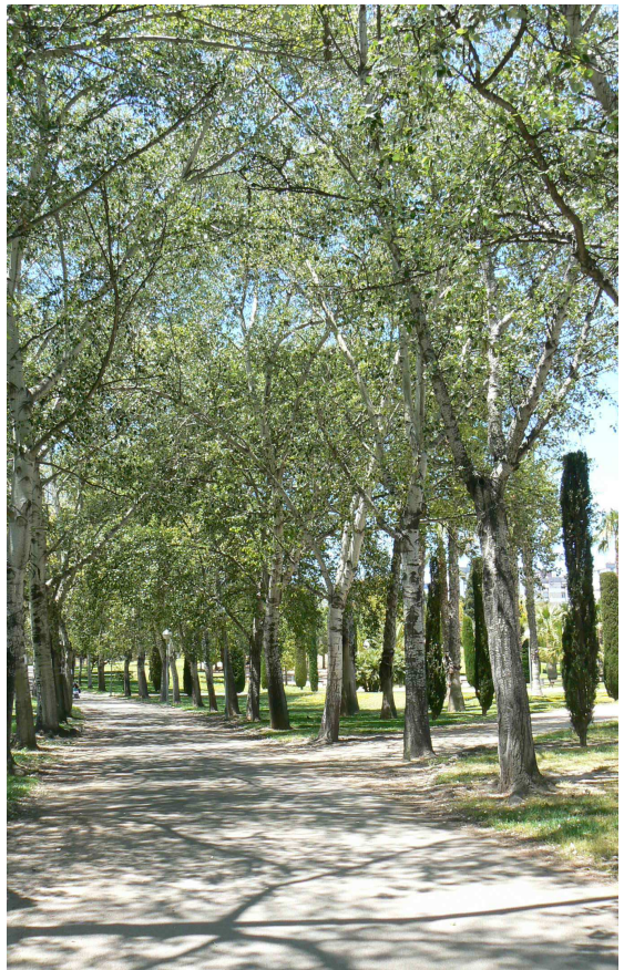
Passeig interior, parc Lo Morant.

La vegetació se situa en funció de l'ús i la naturalesa de l'entorn en què es troba, imprimint caràcter a cada espai. Així, el passeig interior que el rodeja queda delimitat per una filera de xops, donant una sensació de frescor i assossec que invita a realitzar el recorregut. D'altra banda, a la zona de bosc, s'inserix un mobiliari de picnic immers en un ambient natural.