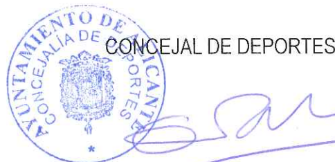
Fdo: Eva Montesinos Mas