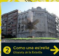
2 Como una estrella Glorieta de la Estrella