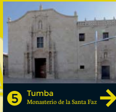
5 Tumba Monasterio de la Santa Faz →