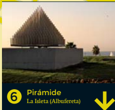
6 Pirámide La Isleta (Albufereta) ↓