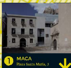
1 MACA Plaza Santa María, 3