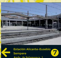
7 Estación Alicante-Eusebio Sempere Avda. de Salamanca, 1