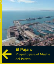
8 El Pájaro Proyecto para el Muelle del Puerto