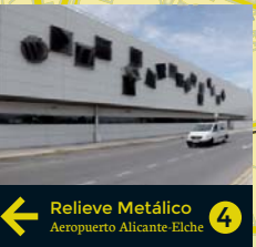
4 Relieve Metálico Aeropuerto Alicante-Elche