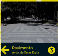
3 Pavimento Avda. de Oscar Esplá