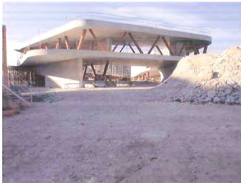
Obra Observatorio Medioambiental Urbano