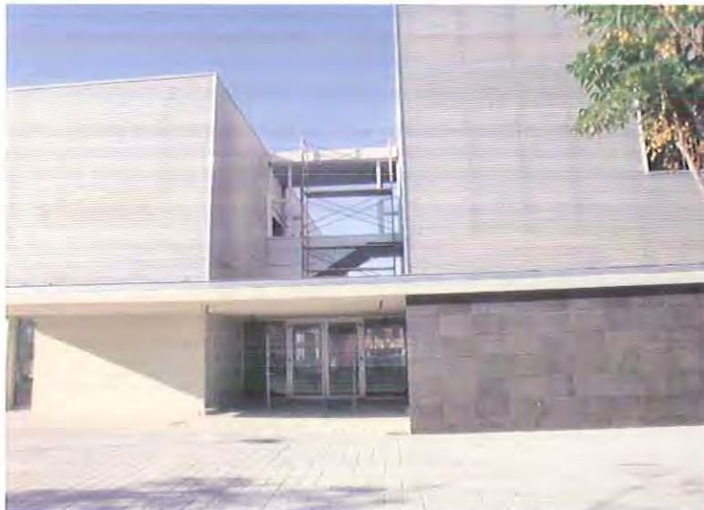
Obra Jefatura Policia Local y Parque de Bomberos