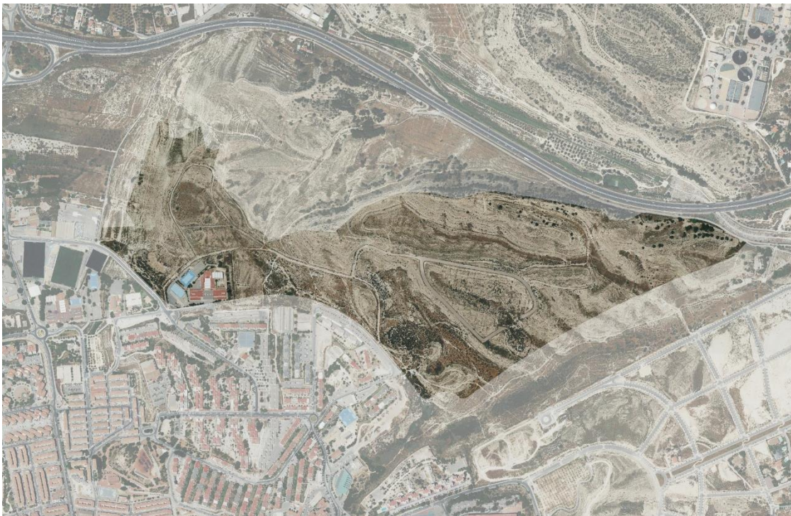
Figura 1. Situación del sector PAU/9 Lomas de Garbinet.