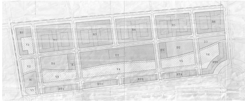
Imagen 1. Copia parcial del plano P-4, Plano de Zonificación.

Como se ha expuesto en los antecedentes, el sector se ordena a través de tres bandas longitudinales. Disponiendo en su franja sur (colindante a Gran Vía) la tipología "RT", en la banda central equipamientos y zonas verdes, y en la franja norte (colindante a Vía Parque) la tipología "R".