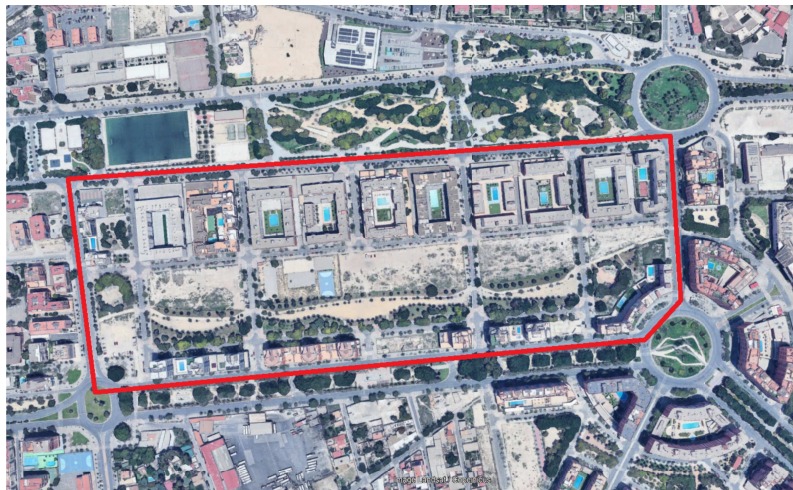
Imagen 1. Ortofotografía PNOA del año 2023, en rojo el ámbito del Plan Parcial sector II/10, Garbinet Norte.

Actualmente el ámbito de la modificación se encuentra consolidado en su mayor parte por edificación, tal y como se puede apreciar en la imagen siguiente.