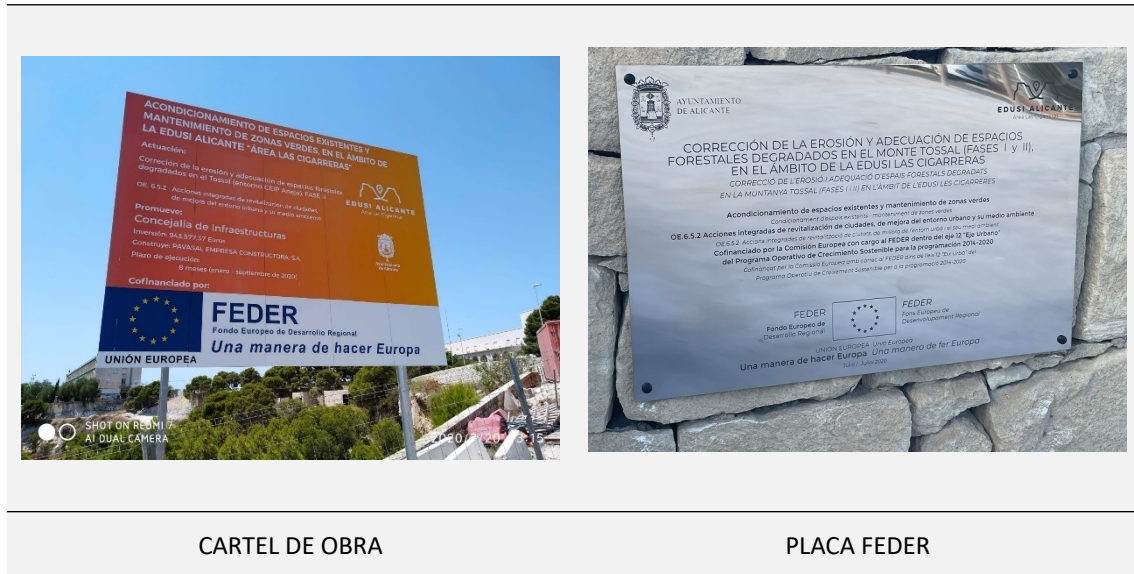
CARTEL DE OBRA

De la misma manera, las actuaciones contaron con sus correspondientes carteles de obra y la instalación de la pertinente placa FEDER, señalando la cofinanciación de la Unión Europea.