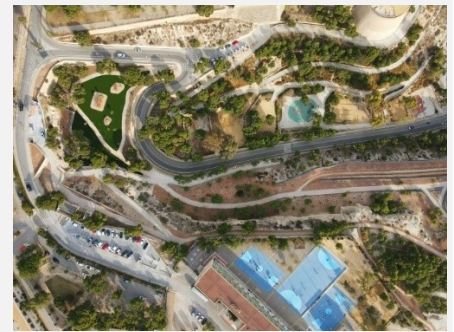
A la derecha, imagen posterior a la actuación