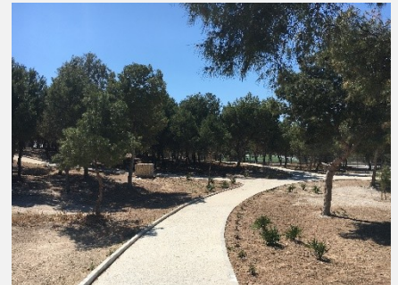
A la derecha, sendero de hormigón