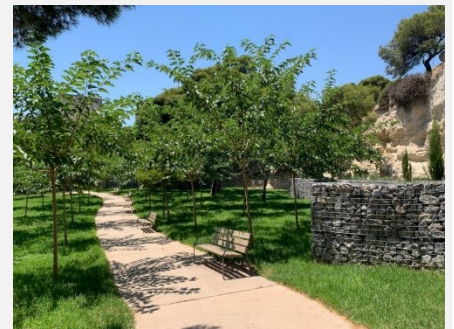
A la derecha, imagen posterior a la actuación.