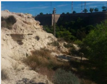
A la izquierda, imagen anterior de la actuación.