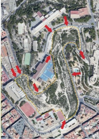
A la izquierda, mapa de accesos de los barrios al Monte Tossal

El conjunto de la actuación fue merecedor, en septiembre de 2022, del galardón en la categoría de Mejor Integración en su Entorno, Sostenibilidad y Mayor Respeto al Medioambiente de la Federación de Obras Públicas y Auxiliares de la Provincia de Alicante, FOPA, en los premios de Obras Públicas que entrega anualmente.