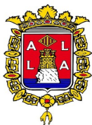
AYUNTAMIENTO DE ALICANTE

1. A tal efecto constará el siguiente texto y escudo: