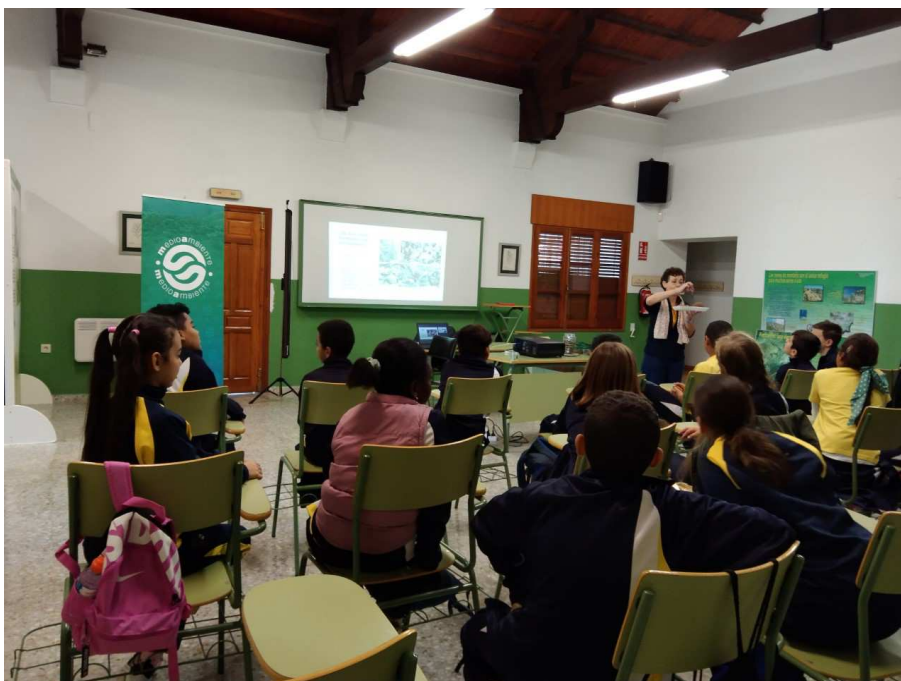
Campaña escolar Posidonia oceanica en CEAM Benacantil

ACTIVIDADES: Mediante una charla dinámica, el alumnado podrá conocer e identificar la planta de Posidonia oceanica y los arribazones, poniendo en valor su importancia a nivel ecológico. Para ello utilizaremos muestras reales recogidas previamente. Esta actividad puede adaptarse a diferentes niveles, de manera que para el primer y segundo ciclo de primaria nos serviremos de un cuento titulado "Mi amiga la Posidonia" y para el resto de niveles utilizaremos una presentación más visual adaptada al grupo destinatario. Para finalizar utilizaremos fichas y juegos que permitirán al alumnado poner en práctica los conocimientos adquiridos.