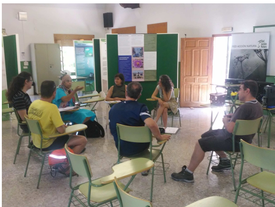
Reunión de voluntariado ambiental en CEAM Benacantil