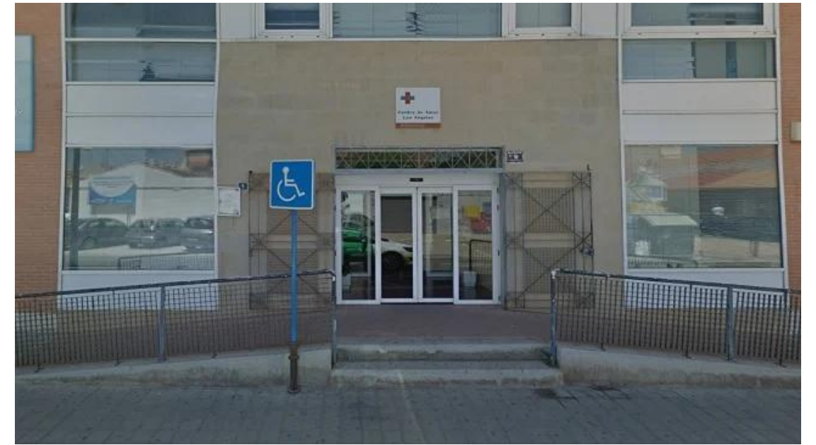
CENTRO DE SALUD LOS ÁNGELES