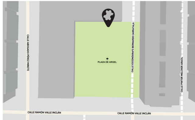
OFICINA PANGEA NORTE Plaza de Argel, 5, 2ª Planta