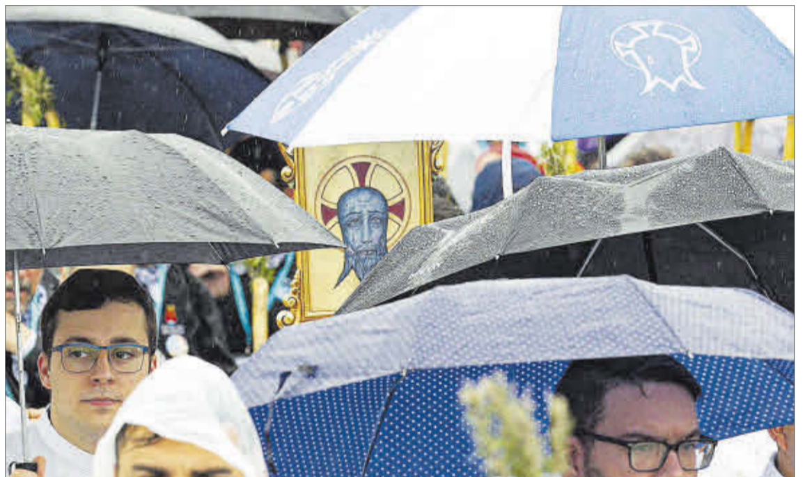
La romería de 2022 fue un mar de paraguas pero muchos participaron tras dos años de parón.