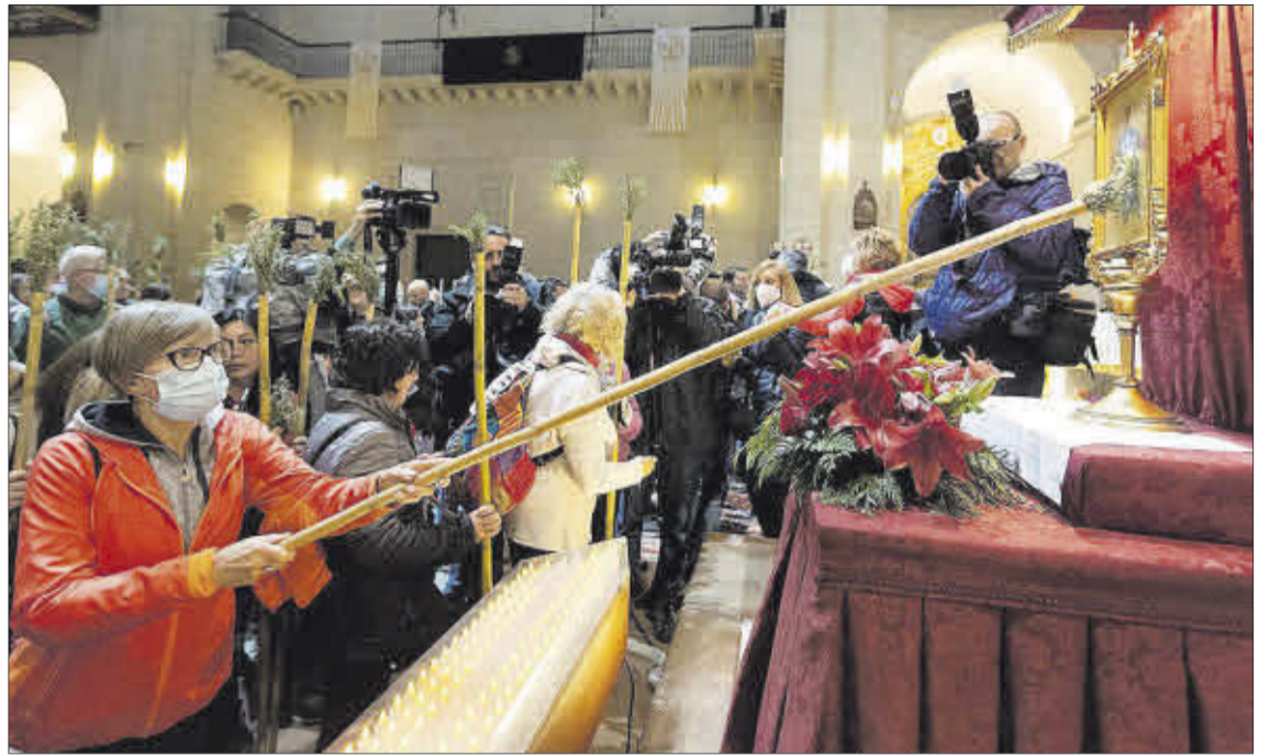
Puesta a punto de la Peregrina oficial para su salida de San Nicolás con destino al caserío.

Fue curioso ver dentro del monasterio a varios peregrinos que pasaron con sus perros, hasta tres, por delante de la Reliquia. Eso sí, antes de que llegara la comitiva oficial de autoridades civiles y eclesiásticas para la misa. En el recorrido se vieron mascotas a las que sus dueños cubrían con mimo, bebés dentro de