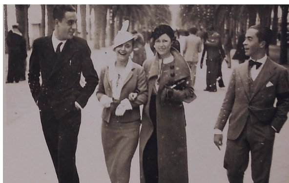
Fig. 1 - Alicante, Paseo del Explanada, 1935.

En cuanto a la mirada de Pepe Estruch sobre su ciudad natal hemos seleccionado algunas citas por la importancia documental y la fuerza emocional que aportan al recordar Alicante, como en su carta del 29 de febrero de 1945 "Querida Eulogia, ... Si vieras cómo os envidio ese tiempo vuestro! Recuerdo que por este tiempo ya tenéis los almendros en flor ¿no?". Se trata de las cartas que Pepe escribe a su madre, que sigue viviendo en España, y debido a la censura política, él se ve obligado a utilizar diferentes tratamientos 4 . Por otra parte, en la carta del 25 de junio de 1945, comenta que está esperando el libro de "Les Fogueres". El del año pasado 5 comenta que le hizo mucha ilusión y evoca su recuerdo de Alicante "Está cambiadísimo y, desde luego