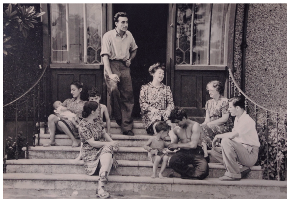
Fig. 3 - The Culvers, la colonia de Carshalton, un día de verano.