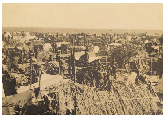
Fig. 2 - Tarjeta postal Carte postal. 18. Saint Cyprien. Une vue du Camp. Una vista del campo