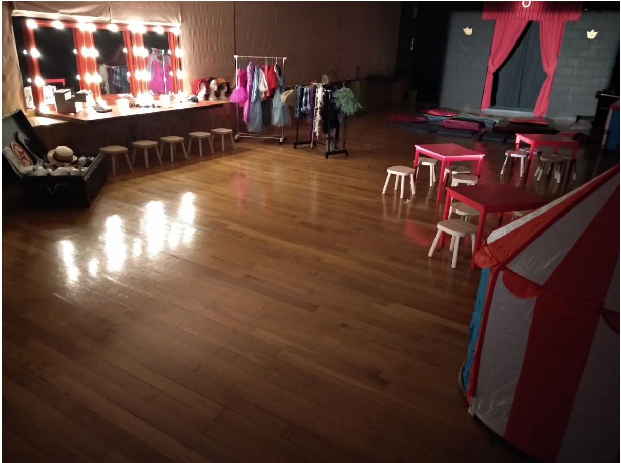
Teatro Principal de Alicante. Sala Nuria Espert

De manera que, solo la persona que rellena el acceso podrá recoger al menor al finalizar la sesión. Además si se produjera cualquier incidente en el transcurso de la representación, el personal de sala podrá localizar al tutor de manera discreta para que pueda atender el requerimiento.