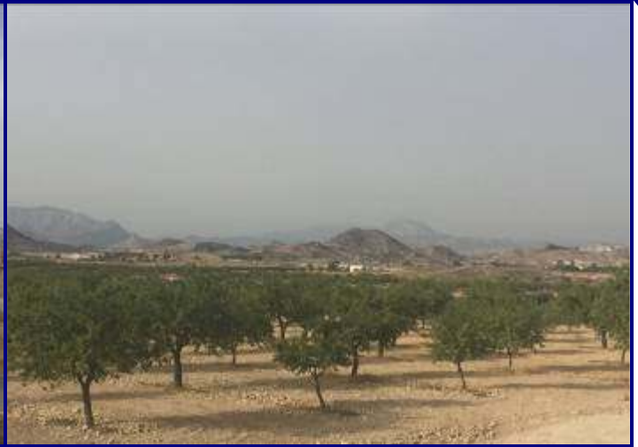
UP.07 L'Alcoraia-EI Rebolledo-Fontcaient (localización ver plano EP-05)