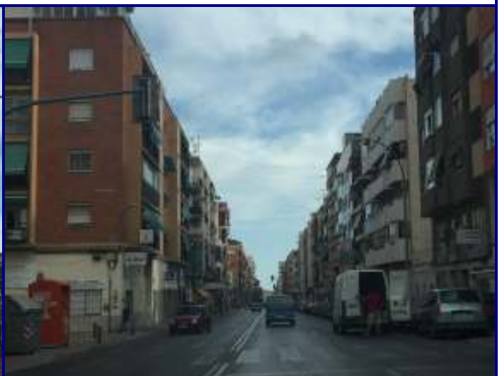
UP.01.15 Els Àngels-Sant Agustí