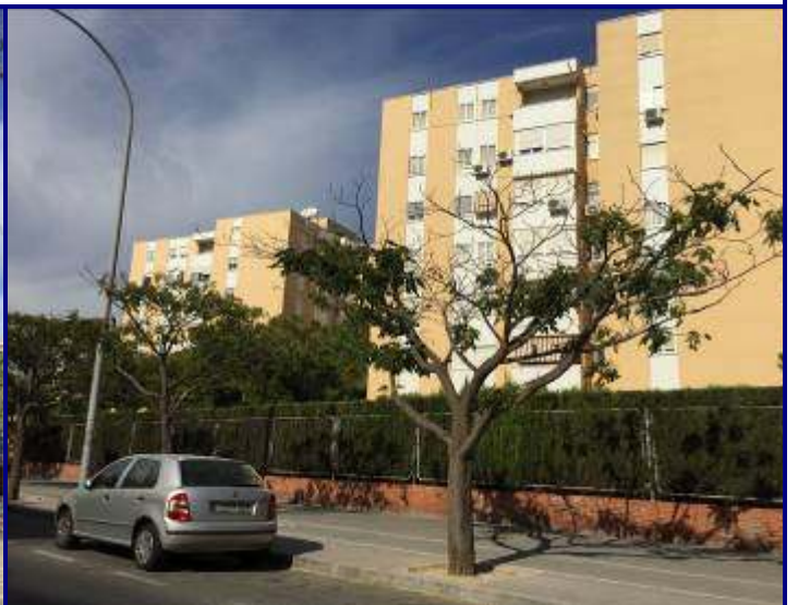
UP.01.06 Nou San Blas