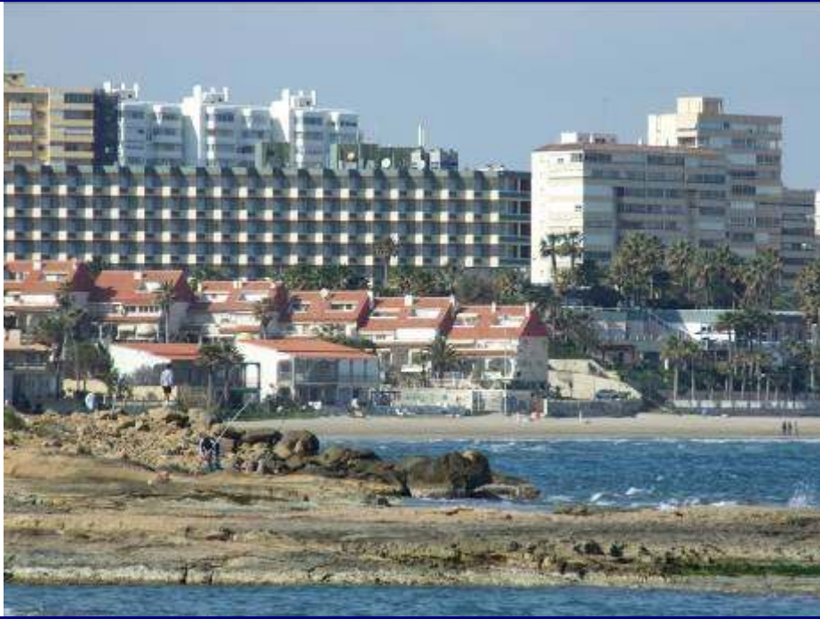
UP.01.28 Cap de L'Horta Urbanitzacions