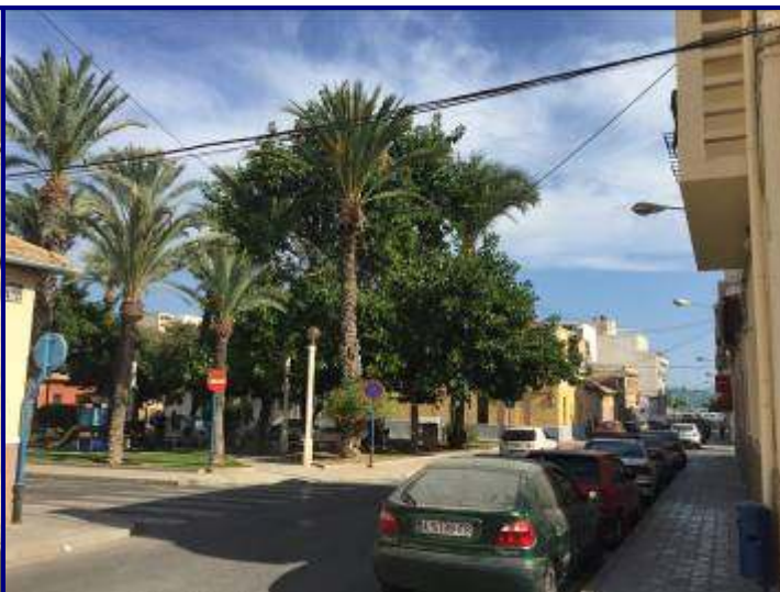
UP.01.02 San Gabriel