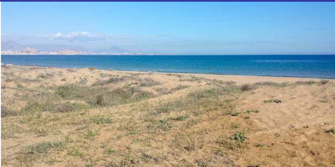
UP.26 Platges i dunes del Saladar i l'Altet (localización ver plano EP-05)