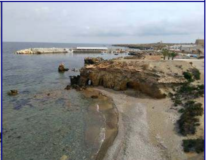
UP.11 Illa de Tabarca (localización ver plano EP-05)