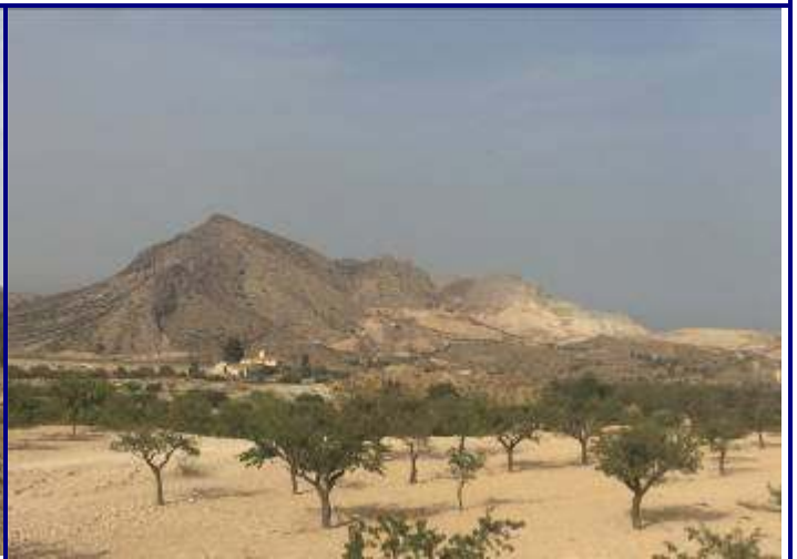
UP.14 Serra Mitjana (localización ver plano EP-05)