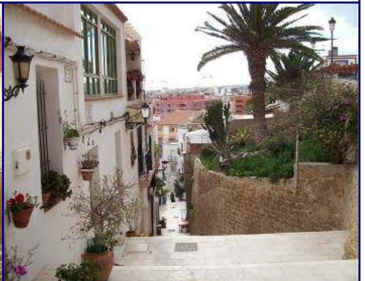
UP.01.11 Centre Històric