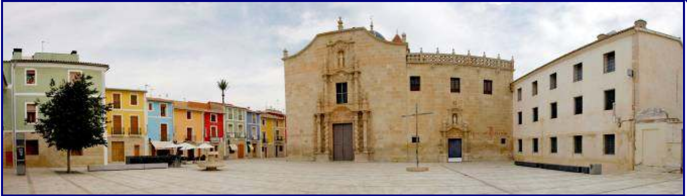
UP.01.25 Núcli Urbà de la Santa Faç