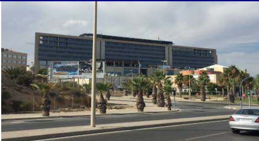
UP.01.29 Colmenars-Aigua Amarga