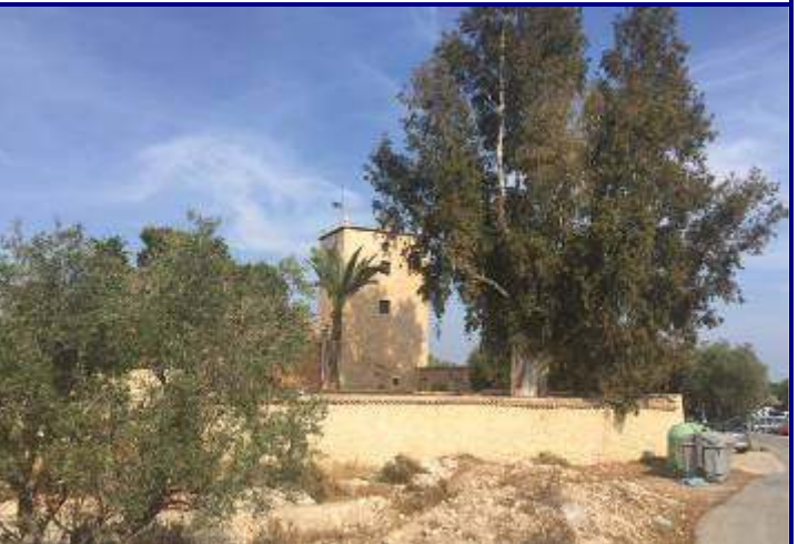
UP.15 Horta d'Alacant (localización ver plano EP-05)