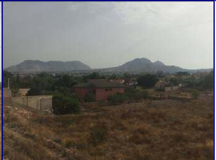
UP.19 El Moralet (localización ver plano EP-05)