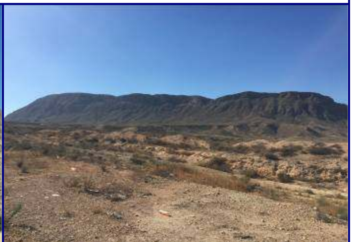
UP.06 Serra de Fontcalent (localización ver plano EP-05)