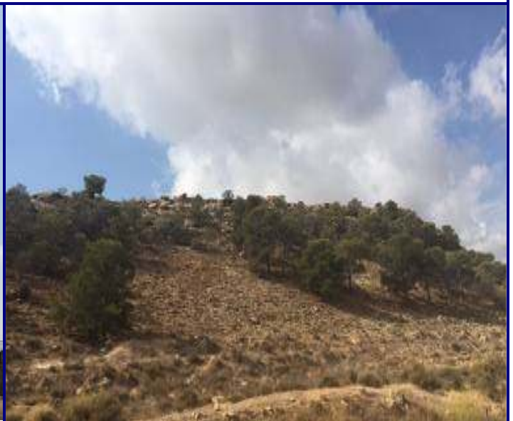
UP.08 Llomes del Garbinet y de Orgègia (localización ver plano EP-05)