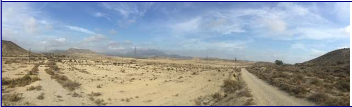
UP.23 El Vergeret (localización ver plano EP-05)