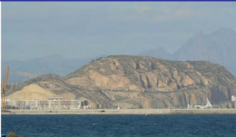
UP.05 Serra Grossa (localización ver plano EP-05)