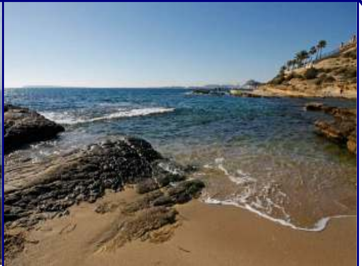
UP.04:- Cap de l'Horta (localización ver plano EP-05)