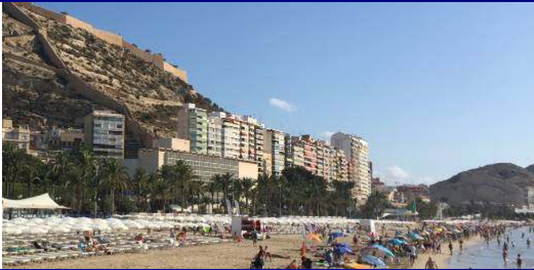
UP.01.22 Raval Roig-Postiguat