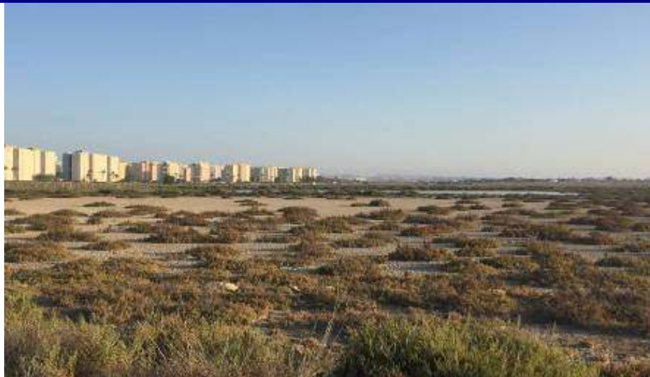
UP. 24 El Saladar (localización ver plano EP-05)