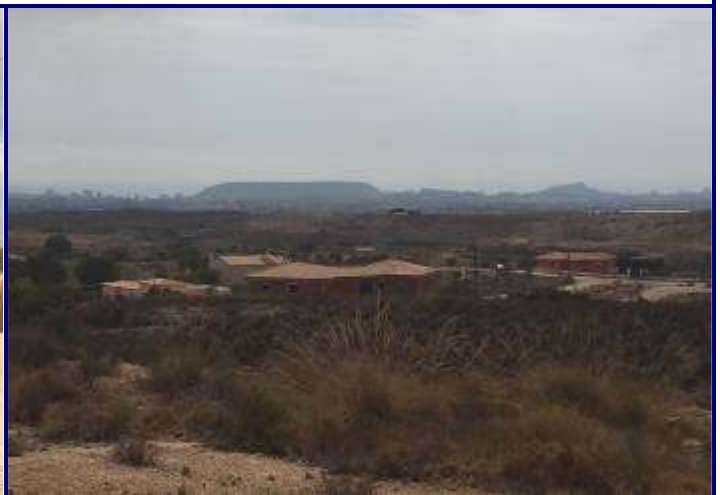
UP.20 Urbanitzacions El Portell-El Boter (localización ver plano EP-05)