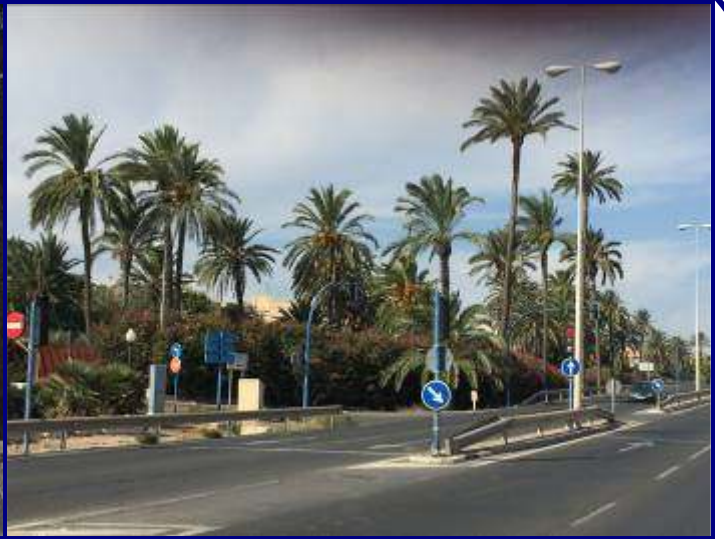
UP.01.13 Babel-El Palmeral