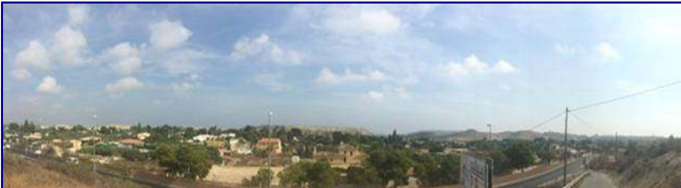
UP.01.19 Horta d'El Palamò