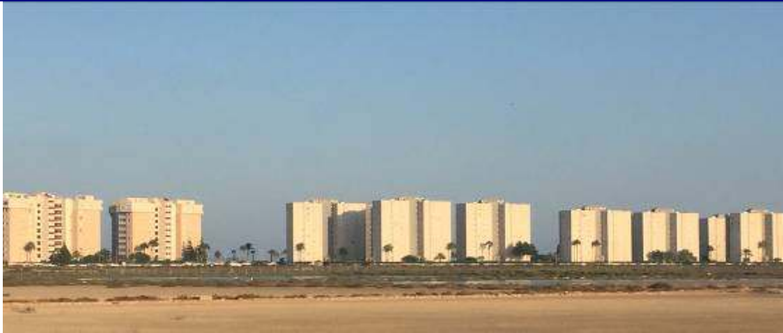
UP.25 Urbanova (localización ver plano EP-05)