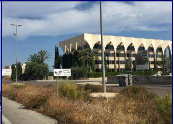
UP.01.30 Indústries d'Aigua Amarga