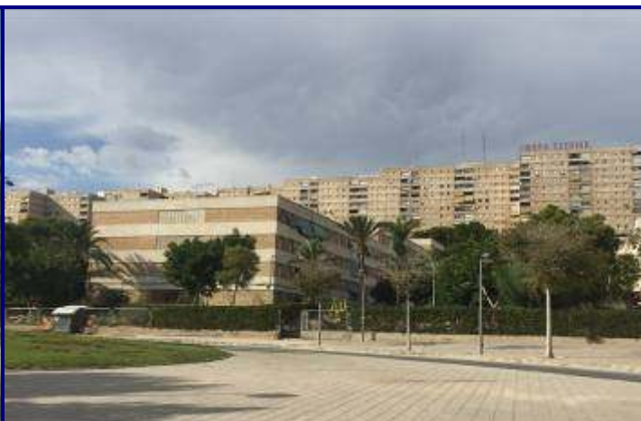
UP.01.03 Juan XXIII-Virgen del Remedio