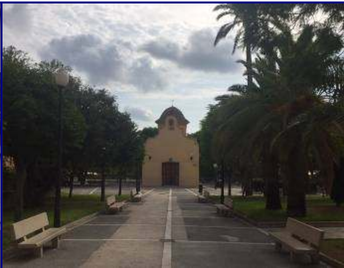
UP.01.20 Nùcli Urbà d'El Palamò