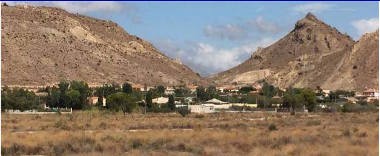
UP.01.32 Urbanitzacions de Fontcalet