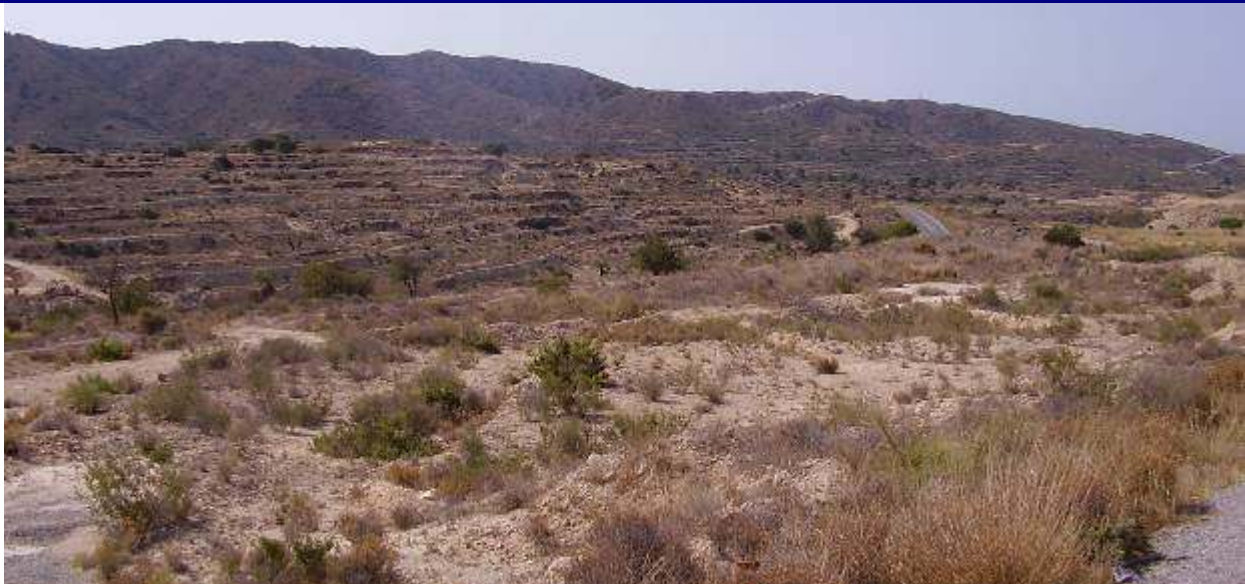
UP.21 Bonalba (localización ver plano EP-05)