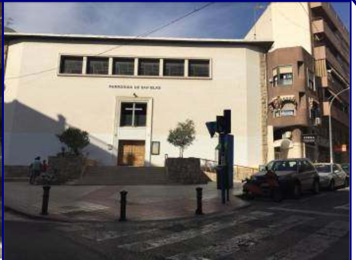
UP.01.07 San Blas