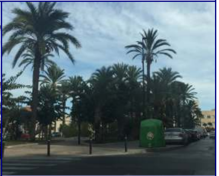
UP.01.14 El Pla