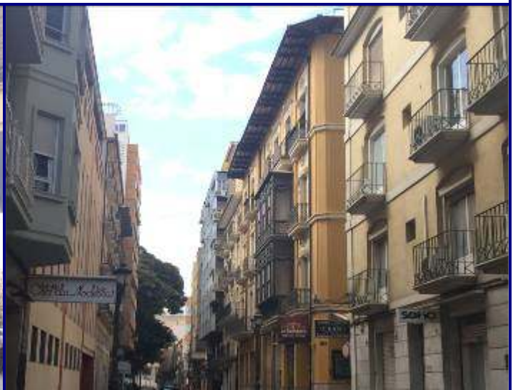
UP.01.08 Centre-Raval de Sant Francesc