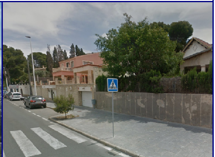
UP.01. 24 Vistahermosa