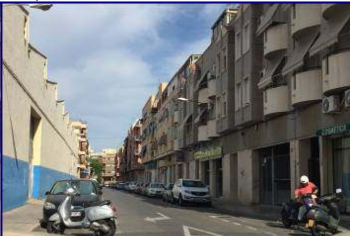
UP.01.01:- La Florida