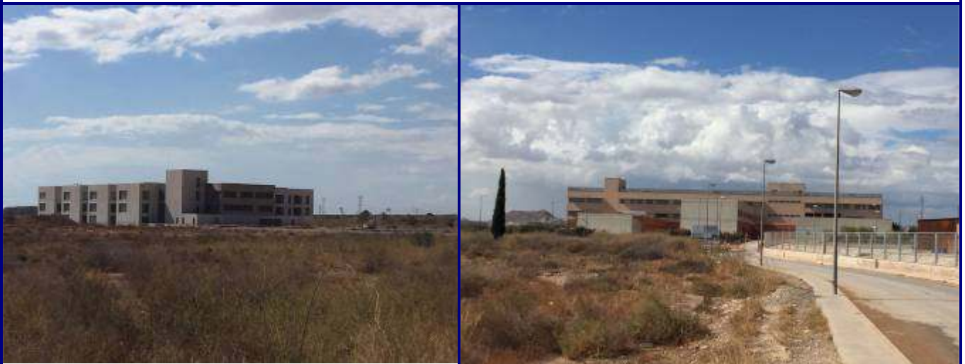
UP.27 Universitat (localización ver plano EP-05)