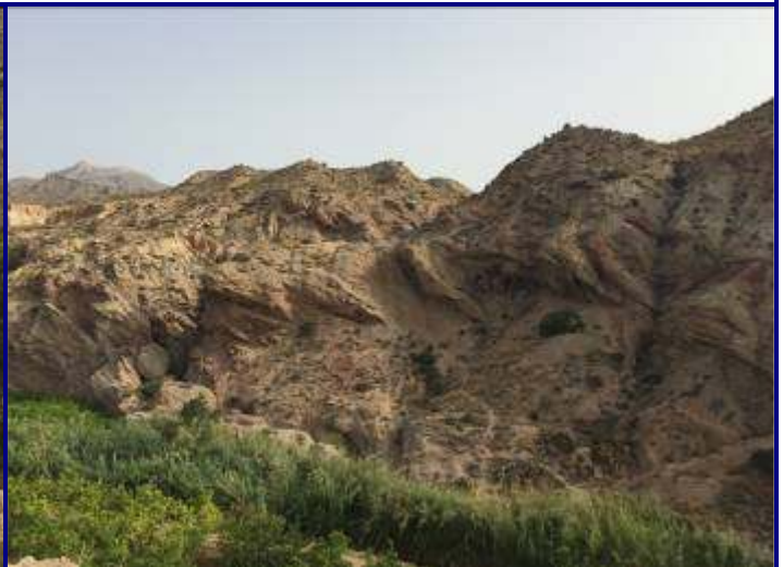
UP. 17 Montnegre (localización ver plano EP-05)