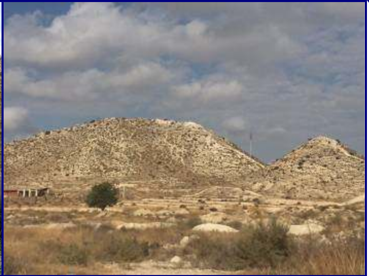
UP.13 Llomes i Llacunes de Rabassa (localización ver plano EP-05)