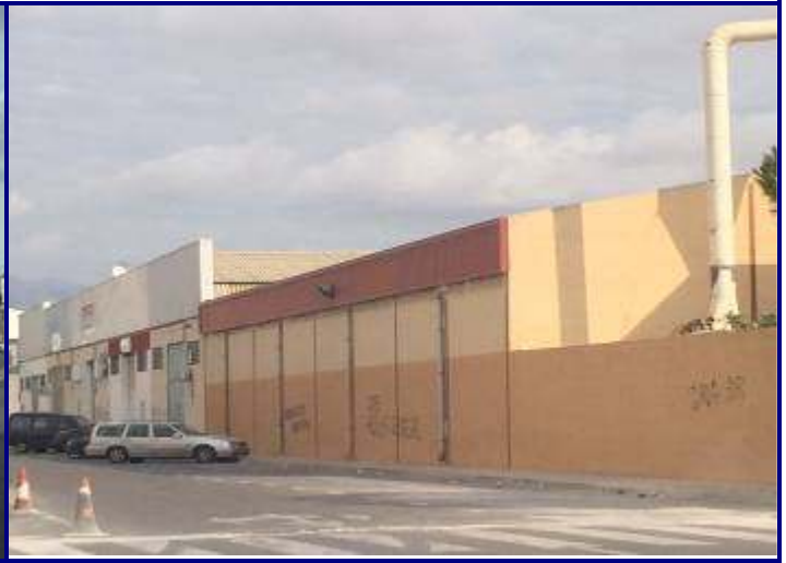
UP.01.23 Zona industrial de Rabassa