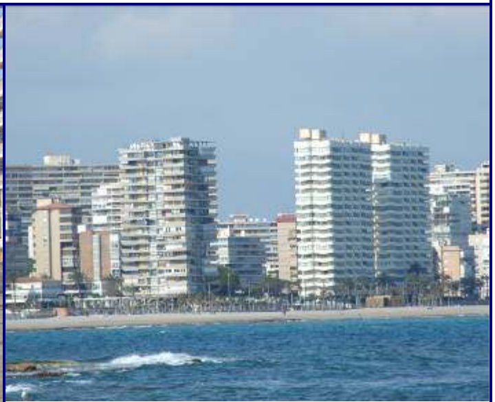
UP.01.27 Platja de Sant Joan