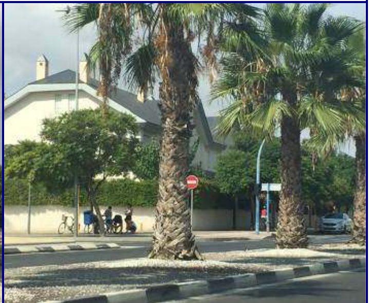
UP.01.26 La Condomina