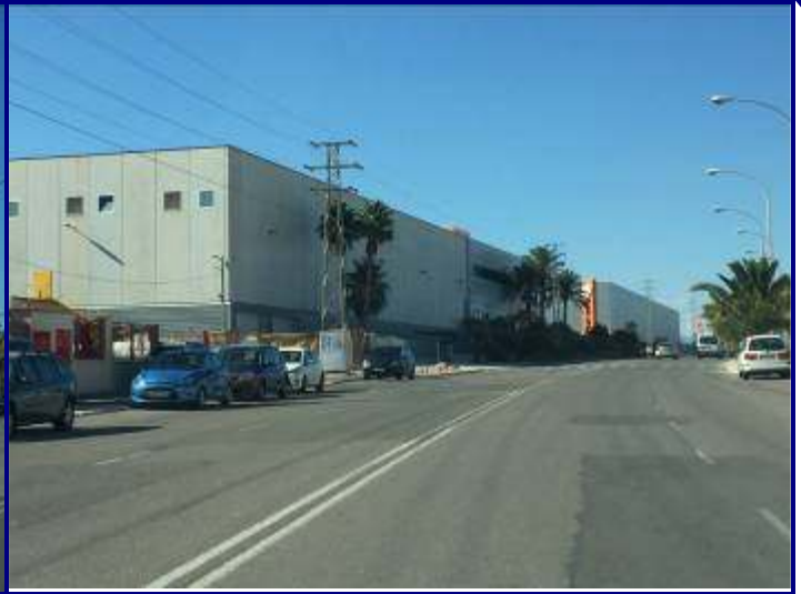
UP.01.16 Àrees industrials oest