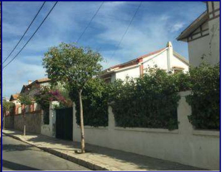
UP.01.05 Ciutat Jardí