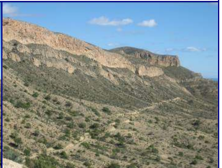
UP.12 Serra de les Àguiles (localización ver plano EP-05)