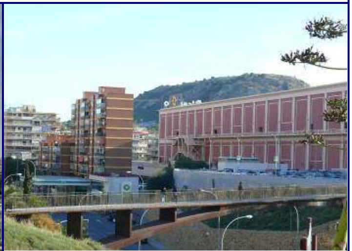
UP.01.17 La Goteta