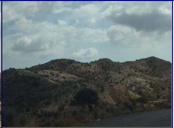
UP.22 Bec de l'Águila-Cap de Montnegre (localización ver plano EP-05)