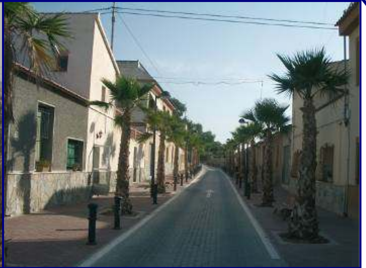
UP. 10 El Verdegás (localización ver plano EP-05)