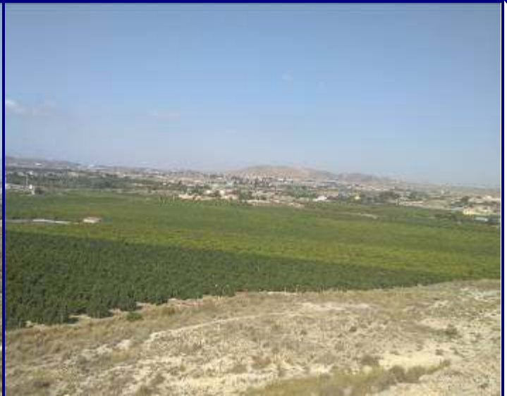
UP.16 Bacarot (localización ver plano EP-05)