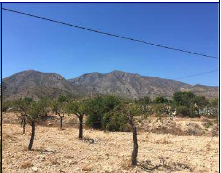
UP.18 Cabeçó d'Or (localización ver plano EP-05)