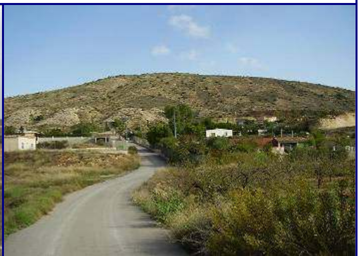
UP.09 Serres del Porquet, Colmenars, Sanxo i Borgonyó (localización ver plano EP-05)