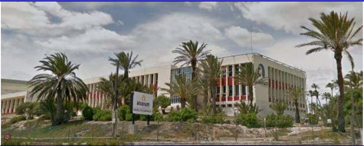
UP.01.31 Palmeral zona industrial