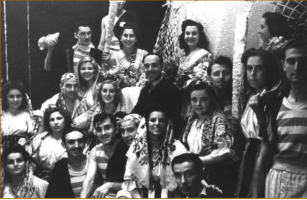
Les anomenades "huestes" de Valcárcel (1943)