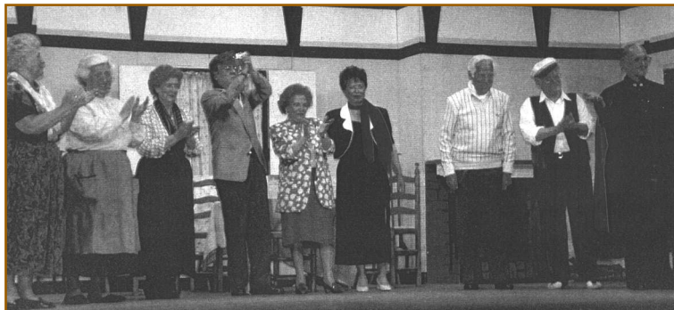
La barca sin pescador (1998) por el grupo Primavera en otoño