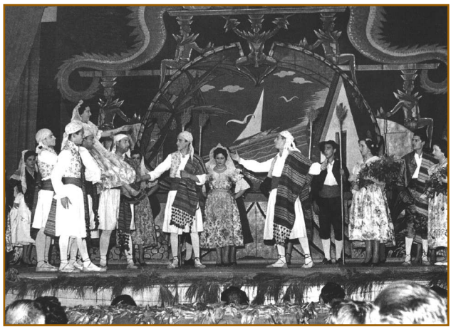
Festival de elección de la Bellea del Foc (1955)

obres que posà en escena foren les seues fantasies ¿Fue bella la Cenicienta? (1944), Amatesamas, Encajes, alamares y marfiles (1956) i Humo del Kiff ; la comèdia La venganza de don Mendo ; el drama poètic Cui-Ping-Sing (1963), d'Agustín, Conde de Foxà, i algunes peces del gènere líric com La Gran Via , La corte de Faraón i El asombro de Damasco . També es destacà en la direcció de les representacions anuals del Don Juan Tenorio el dia de Tots Sants, on participaven més de 250 actrius i actors en una autèntica mobilització de masses. En total, Valcárcel arribà a muntar més d'un centenar d'espectacles, tots dirigits amb suma mestria i amb un magnífic efecte plàstic, que assoliren una popularitat indiscutible. Generalment, Valcárcel escrivia el guió de les funcions, dissenyava els decorats, confeccionava els esbossos dels vestits dels personatges, s'encarregava del muntatge i dirigia la funció. És a dir, feia alhora de director artístic i d'escena, controlant meticulosament tot l'espectacle des del principi fins al final. En definitiva, la seua figura abraça quasi mig segle de la història de l'escena alcantina.