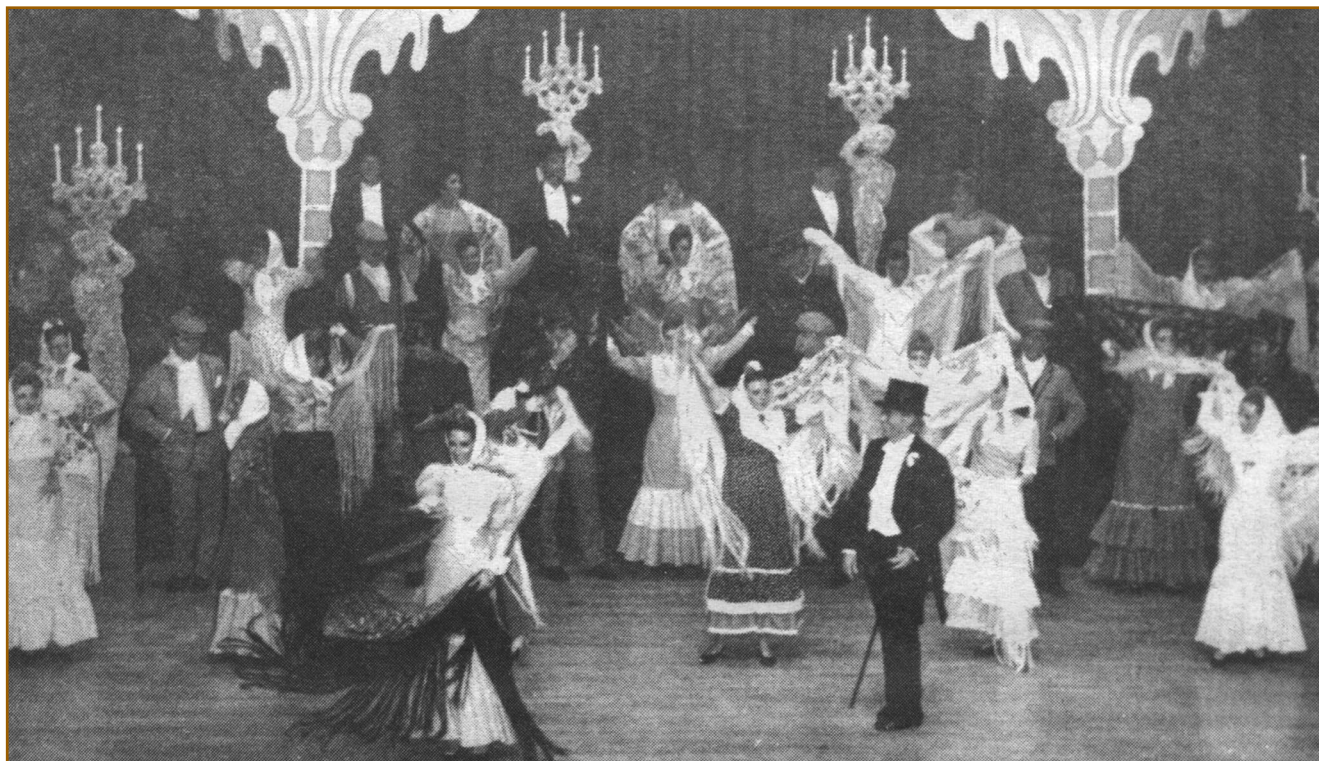
La Gran Via